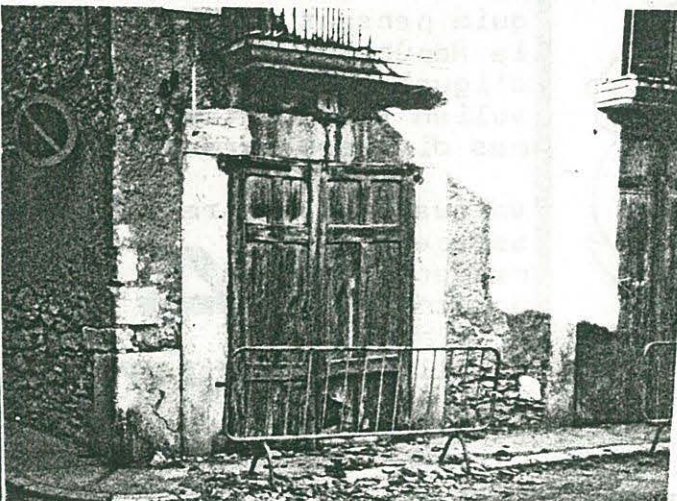
CANTONADA CARRER COMERÇ I MURADA DE BAIX. DAVANT DE CASA TRAMPA I PROP DEL "SAVOI"